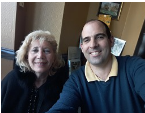
Le commando est au complet avec son accompagnatrice de charme

Cette Tongerlo ambrée a un doux parfum de « reviens-y ».