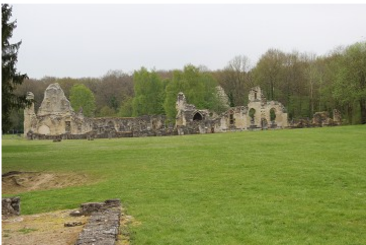
Une partie des ruines