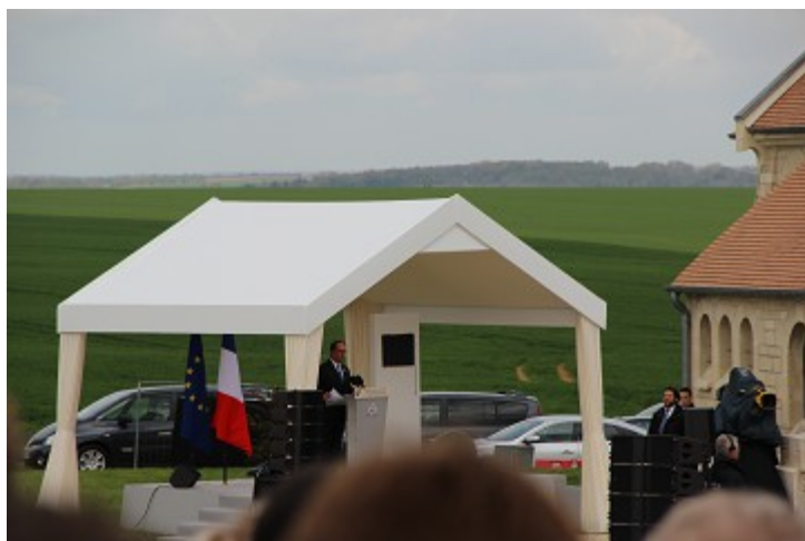
Le Président à la tribune

Ensuite, le Président a fait son discours officiel, un petit peu long mais bien.