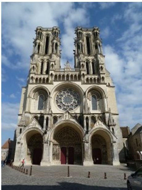
Cathédrale de Laon

En arrivant à Laon, après contact téléphonique, la jonction des deux équipes de choc s'est opérée devant la cathédrale, dans un petit établissement, très respectable, autour d'une table et surtout avec une bière à la main.