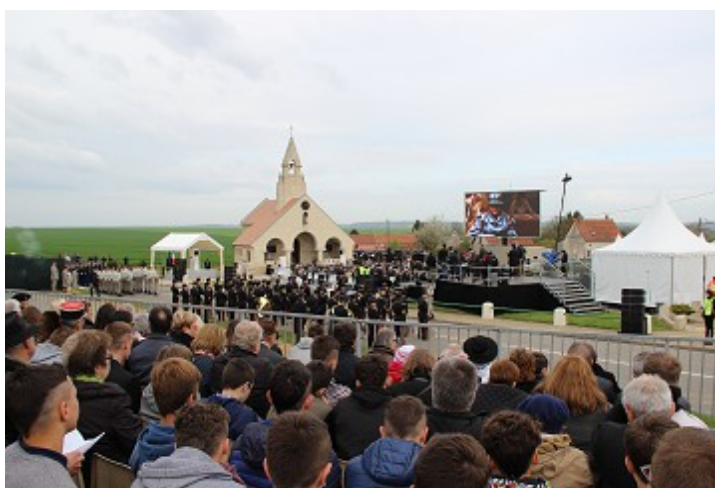
Ensemble du dispositif avec chapelle, troupes, écran géant...

Très bien placés pour la vision totale de la chapelle, des discours et de l'écran géant.