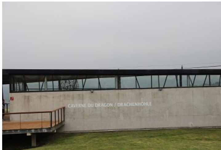
Le musée de la Caverne du Dragon