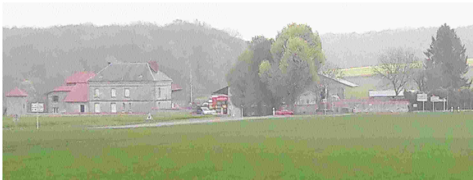
La ferme Hurtebise, à côté de la Caverne du Dragon

Ensuite, nous avons repris le Chemin des Dames vers l'Est, et nous nous sommes arrêtés à la ferme d'Hurtebise pour faire quelques photos.