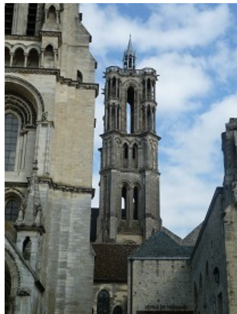
Autre clocher de la Cathédrale de Laon