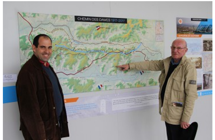
Carte murale du Chemin des Dames