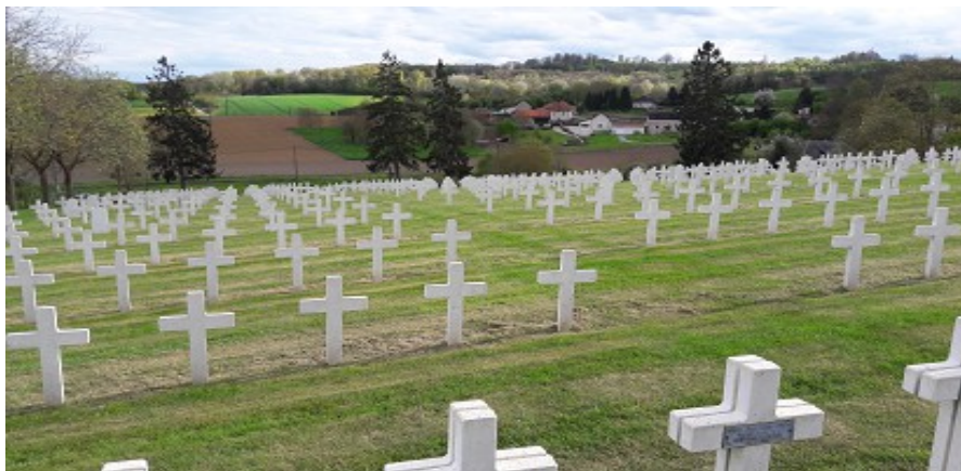
Nécropole de Craonnelle

Ensuite, pour ne pas être venus pour si peu, ils sont aussi allés jusqu'à la nécropole de Craonnelle , où ils ont fait de même. Et, là encore, ils ont pris 18 photos de tombes du 144 .