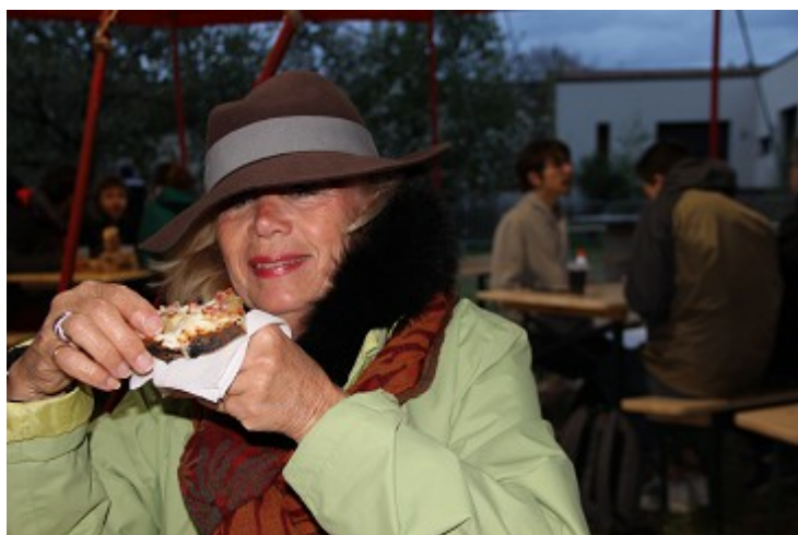
Spectatrice attentive... et affamée

Un très grande foule a fait le déplacement, et grâce aux très importantes mesures de sécurité mises en place, tout s'est passé dans le calme et sans aucun problème.