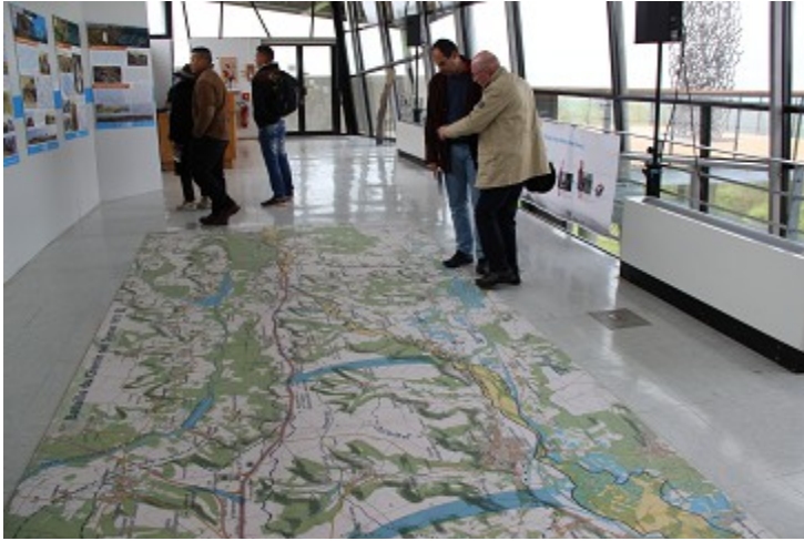
Carte du Chemin des Dames au sol