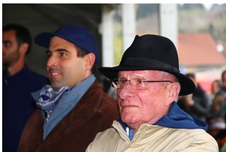
... et spectateurs aussi

Puis, le spectacle a débuté. Ce fût une très grosse production financée par le département de l'Aisne. Sons, lumières et pyrotechnies étaient vraiment somptueux, avec de nombreux figurants, répartis dans plusieurs tableaux successifs qui se déroulait de part et d'autre de la scène centrale, très grande et surmontée par un écran géant. L'ensemble des installations scéniques faisait plus de 70m mètres de front. Nous avons profité de ce très beau spectacle qui a duré près de 2h00, quand même, et qui s'est terminé par un superbe feu d'artifice, dont les échos des explosions nous revenait du côté gauche, venant du Chemin des Dames, comme s'il voulait nous rappeler qu'il est là, lui aussi.