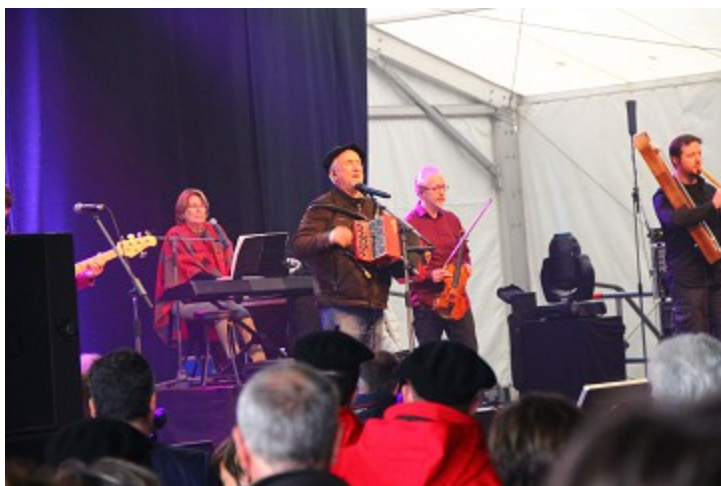
Groupe Béarnais Nadau sous chapiteau

Nous avons pris notre dîner sur place, et profité des nombreux concerts sous chapiteaux, dont un groupe Corse avec de très belles voix et un groupe Béarnais, haut en couleur et très sympathique qui nous ont permis de patienter jusqu'à la tombée de la nuit.