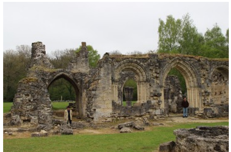
Une autre partie