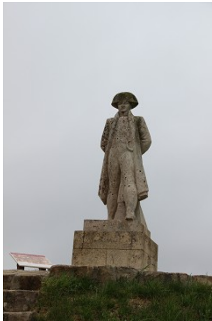
Statue de Napoléon à l'emplacement du Moulin de Vauclair

Ensuite, nous nous sommes arrêtés à l'emplacement du Moulin de Vauclair , qui a été décrit et dessiné par le Capitaine De Menditte, et dont il ne reste plus rien non plus. C'est sur la base restante du moulin, qu'il a été érigé une statue de Napoléon regardant vers le sud. Nous sommes en plein vent glacial.