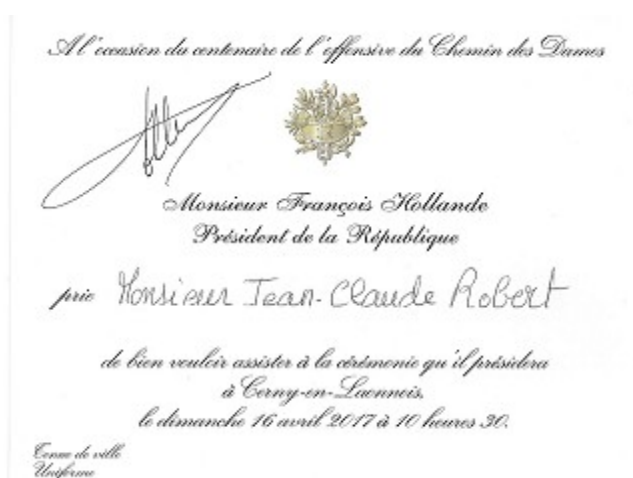
Invitation dédiée par le Président de la République