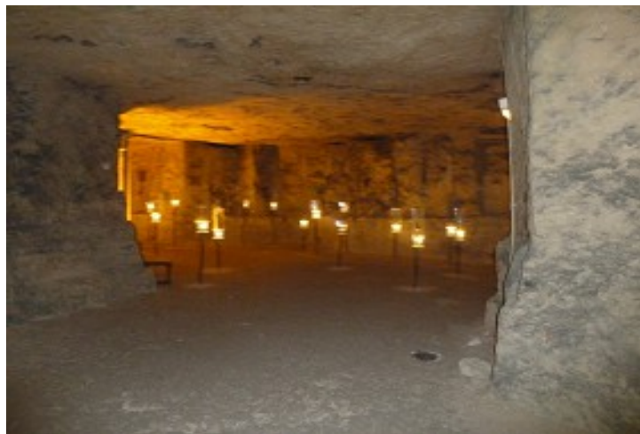
Autre partie de l'intérieur de la Caverne du Dragon

Notre guide, très charmante, était aussi très sympathique et pleine de connaissances et d'anecdotes qui ont rendu la visite très vivante. Tout le monde l'écoutait avec grande attention.