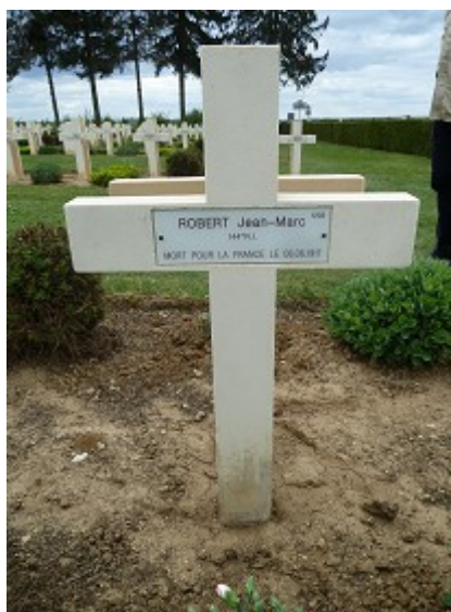
Première tombe trouvée dans la Nécropole de Cerny

Après une brève visite du site, agrémenté d'une petite exposition relatant la guerre de 14-18 pour patienter, avant l'heure de la cérémonie, nous avons aussi tenté de faire un petit tour à l'intérieur de la nécropole, située juste à côté. Nous avons marché quelques mètres et la première tombe que nous avons vue, au hasard devant nous, était celle d'un ancien du 144 ème R.I. !!!