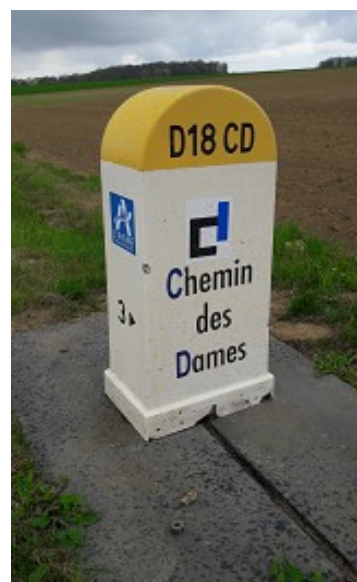
Borne sur le Chemin des Dames

Ensuite notre équipe de choc a fait un bref retour au bivouac « IBIS », pour une remise en condition, avant d'enchaîner sur la mission suivante : Voir le spectacle sons et lumières de Craonne . Le délai était très court car nous devions absolument partir assez tôt, avant la fermeture des routes !!!