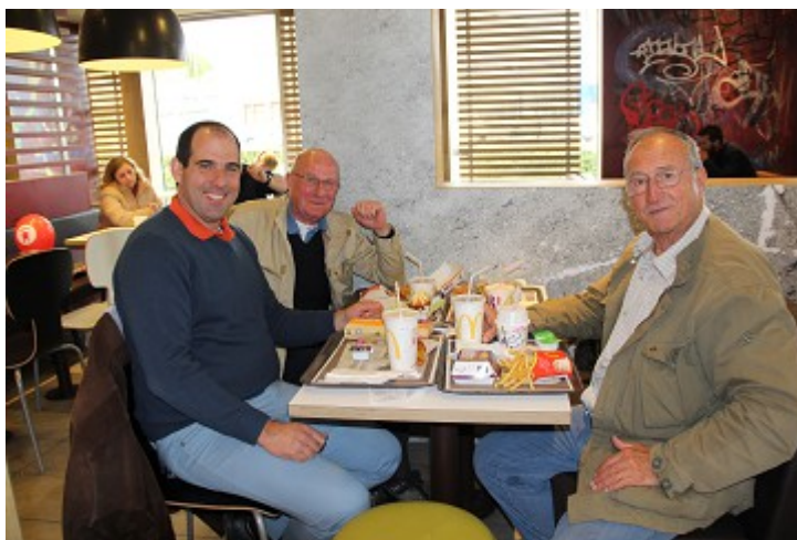
A table !!!

Après un bref passage de remise en condition au bivouac nous sommes ressortis aussitôt pour trouver une crèmerie afin de satisfaire nos estomacs. Malheureusement à cette heure là, il ne restait que la popote de nos camarades Américains, de la compagnie Mac Donald, stationnée non loin, qui est encore ouverte.