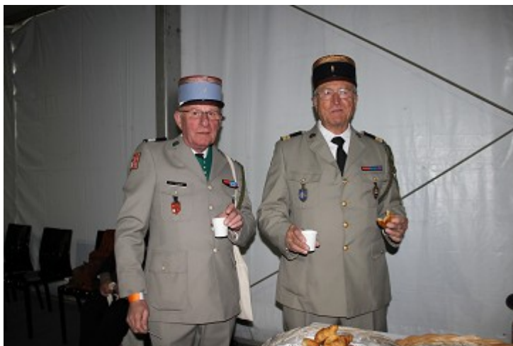
Enfin le petit déjeuner

Accueillis sous un immense chapiteau, nous dégustons avec grande joie ce bon jus bien chaud et ces viennoiseries qui descendent directement au plus profond de nos estomacs affamés.