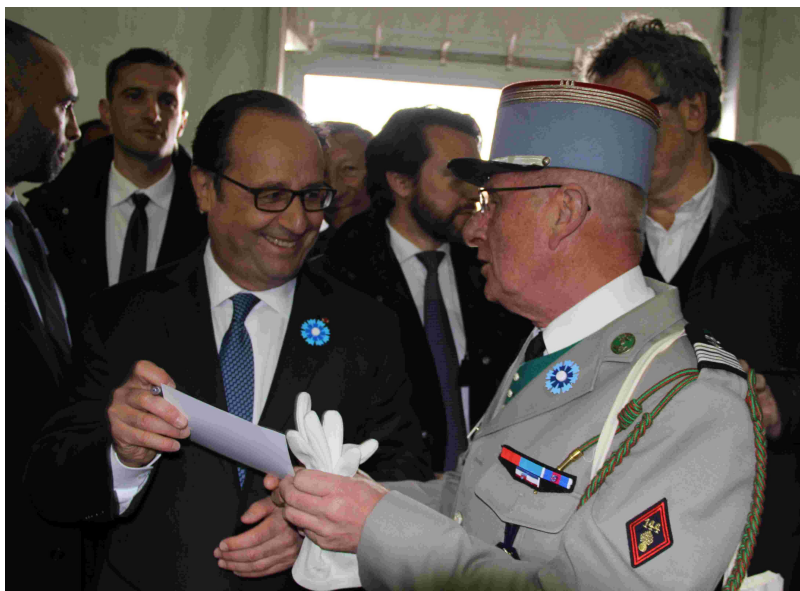
Le Président de la République et le Vice-président de l'Amicale