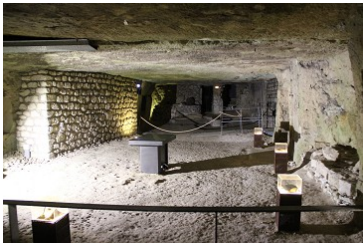
Intérieur de la Caverne du Dragon

Ensuite, nous avons visité la Caverne. C'est une ancienne carrière de pierre, souterraine, dont les galeries s'étendent sur 3 km de long , à l'intérieur de la veine calcaire du plateau, sous le Chemin des Dames, et qui a été beaucoup utilisée comme point d'observation , puis comme abri et hôpital de campagne par les Allemands , et par les Français , à tour de rôle, au fur et à mesure des conquêtes successives.