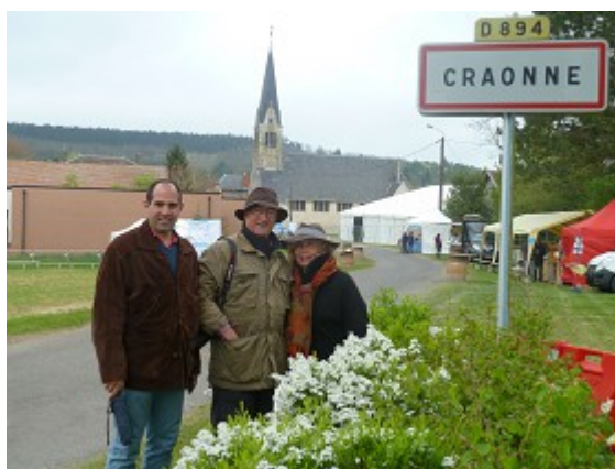
Trois des participants à l'entrée de Craonne

Puis, nous avons poussé jusqu'à l'extrémité Est du plateau, qui se termine en contrebas du Chemin des Dames, par le village de Craonne .