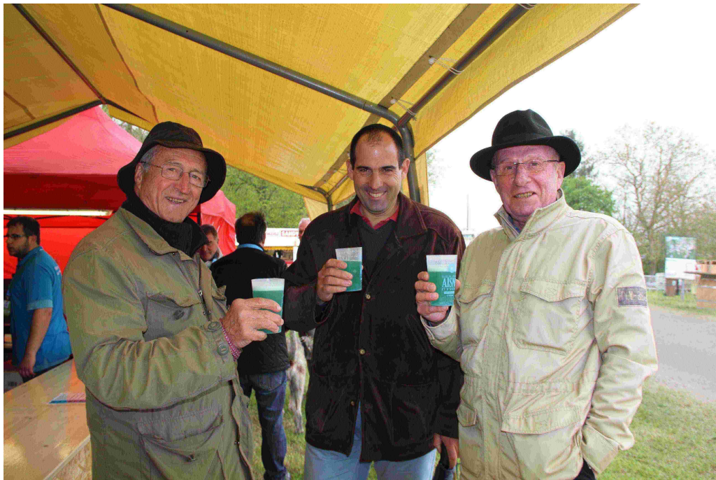
La bière bleue

A l'approche de l'heure du repas de midi, nous avons donc dégusté une « bière bleue » (la bière du centenaire), à l'abri du vent et de la petite pluie fine qui tombait en alternance, avant de prendre notre déjeuner sous une tente, et dans le froid, car il fait environ 11°C.