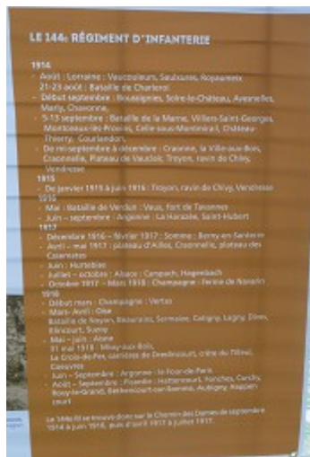
Historique succinct du 144 dans la Grande Guerre

Sur cette exposition, notre régiment y est très explicitement présenté, avec son historique et toutes les dates des batailles auxquelles il a participé. C'est vraiment une très bonne surprise pour la mémoire de notre régiment et pour la vie de notre Amicale.