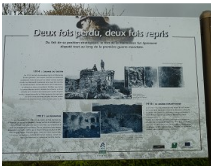
Descriptif du Fort de la Malmaison

Peu après 15h00 nous avons repris le Chemin des Dames mais dans l'autre sens cette fois, vers l'Ouest , en regardant avec précision tous les paysages et toutes les fermes qui jalonne cette crête jusqu'à son extrémité Ouest : Le fort de la Malmaison , dont il ne reste plus rien non plus, qu'une zone de ruines, envahie par la végétation et interdite au public.