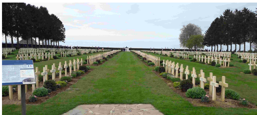
Nécropole de Cerny en Laonnois